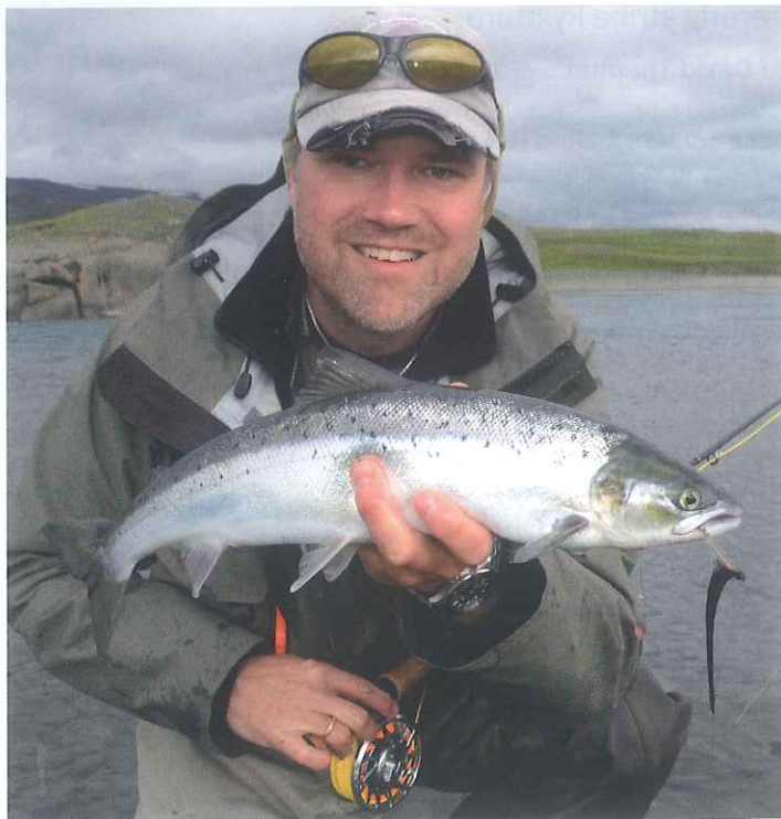
Artikelforfatteren med en af turens laks, taget på en Sunray Shadow.